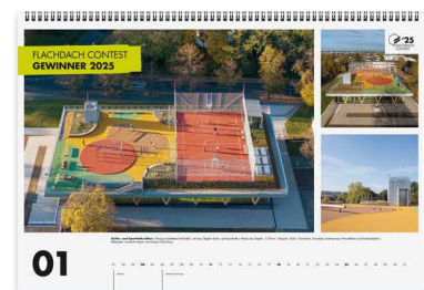
Großflächige Präsentation der Top 12 Gewinner-Projekte im Jahreskalender.