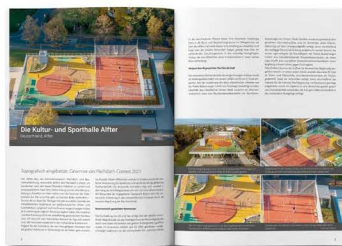
Ausführliche Berichterstattung über die Gewinner im Heinze Journal.