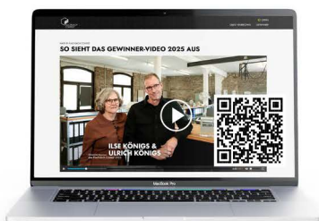
Professionelle Film-Dokumentation über die Gewinner.

Nutzung der offiziellen Signets für die Plätze 1–12 in PR und Marketing.