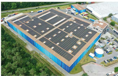
Die Logistikhalle Eco Hub verfügt über die größte PV-Gründach-Kombination Europas.

Energiedach: Photovoltaik und Solarthermie. Strom oder Warmwasser vor Ort zu erzeugen und zu verbrauchen, das macht das Energie-Flachdach zu einem wichtigen Baustein der Energiewende.