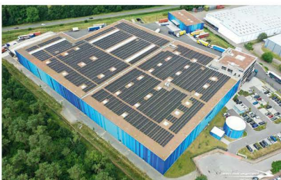
Die Logistikhalle Eco Hub verfügt über die größte PV-Gründach-Kombination Europas.

Energiedach: Photovoltaik und Solarthermie. Strom oder Warmwasser vor Ort zu erzeugen und zu verbrauchen, das macht das Energie-Flachdach zu einem wichtigen Baustein der Energiewende.