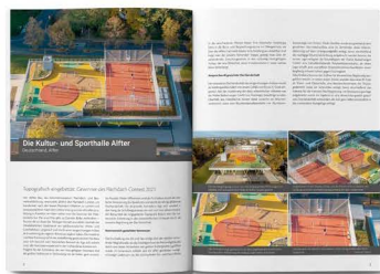
Ausführliche Berichterstattung über die Gewinner im Heinze Journal.