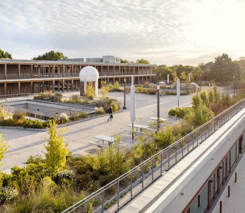
Die multifunktionale Dachlandschaft des Gymnasiums Langenhagen überzeugt mit 29.000 m 2 Nutzfläche und gehört zu den bestplatzierten Projekten des Wettbewerbs 2025.