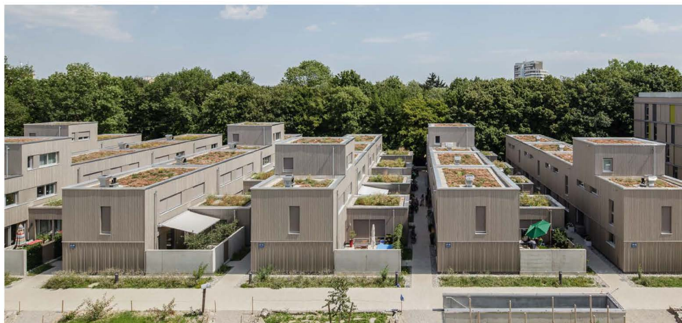
Das Münchener Wohnungsbauprojekt „Der kleine Prinz“ verfügt über eine extensive Dachbegrünung sowie über Flächen zum Urban Gardening; es erreichte damit den 3. Platz.

Aufstockung: zusätzlicher Raum. Die vertikale Erweiterung von Gebäuden bietet eine nachhaltige Lösung für den Wohnraummangel und ermöglicht zudem eine effiziente Nutzung bestehender Gebäudestrukturen.