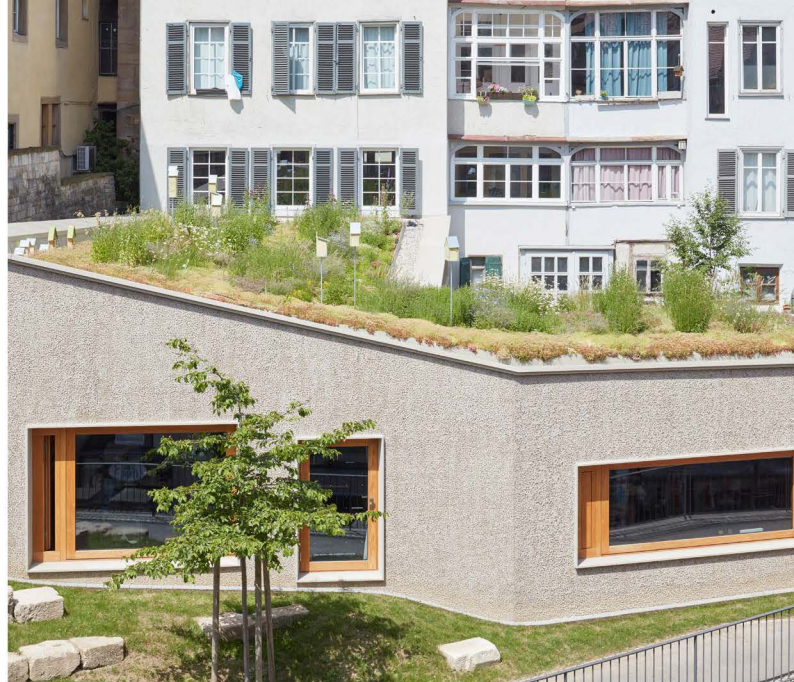
Das Gewinner-Objekt 2023: der Um- und Anbau eines Wohn- und Geschäftsgebäudes in Tübingen.