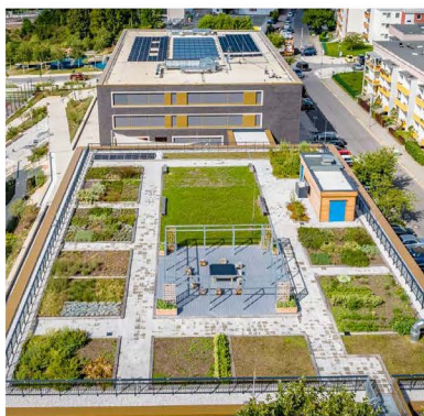
Das Sporthallendach einer Grundschule in Chemnitz wurde intensiv begrünt; es wird seitdem als Schulgarten genutzt.

Gründach: Raum für Flora und Fauna. Extensiv oder intensiv begrünte Flachdächer schaffen Lebensraum für Pflanzen und Tiere. Sie senken Oberflächentemperaturen, erhöhen die Lebensdauer der Abdichtung und tragen zur Wärmedämmung bei. Zudem verbessern Gründächer das Mikroklima in Städten.