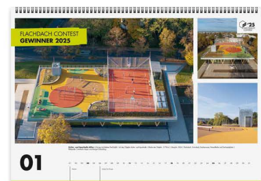
Großflächige Präsentation der Top 12 Gewinner-Projekte im Jahreskalender.