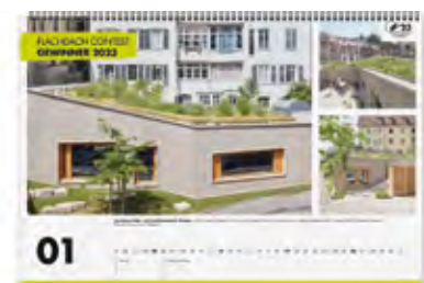
Großflächige Präsentation der Top 12 Gewinner-Projekte im Jahreskalender.