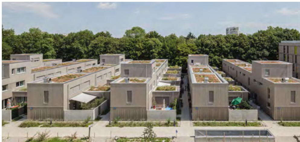
Das Münchener Wohnungsbauprojekt „Der kleine Prinz“ verfügt über eine extensive Dachbegrünung sowie über Flächen zum Urban Gardening; es erreichte damit den 3. Platz.

Aufstockung: zusätzlicher Raum. Die vertikale Erweiterung von Gebäuden bietet eine nachhaltige Lösung für den Wohnraummangel und ermöglicht zudem eine effiziente Nutzung bestehender Gebäudestrukturen.