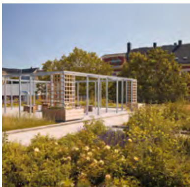
Das Sporthallendach einer Grundschule in Chemnitz wurde intensiv begrünt; es wird seitdem als Schulgarten genutzt.

Gründach: Raum für Flora und Fauna. Extensiv oder intensiv begrünte Flachdächer schaffen Lebensraum für Pflanzen und Tiere. Sie senken Oberflächentemperaturen, erhöhen die Lebensdauer der Abdichtung und tragen zur Wärmedämmung bei. Zudem verbessern Gründächer das Mikroklima in Städten.