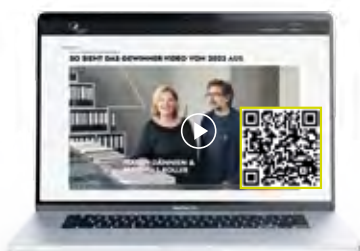
Professionelle Film-Dokumentation über die Gewinner.