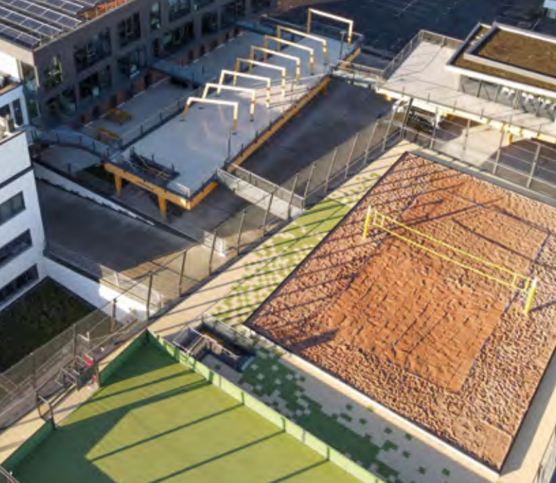
Platz 2 des Flachdach Contest 2023: Der Busines & Beach Campus in Würzburg kombiniert verschiedenste Flachdachnutzungen, darunter eine Sport- und Spielfläche.