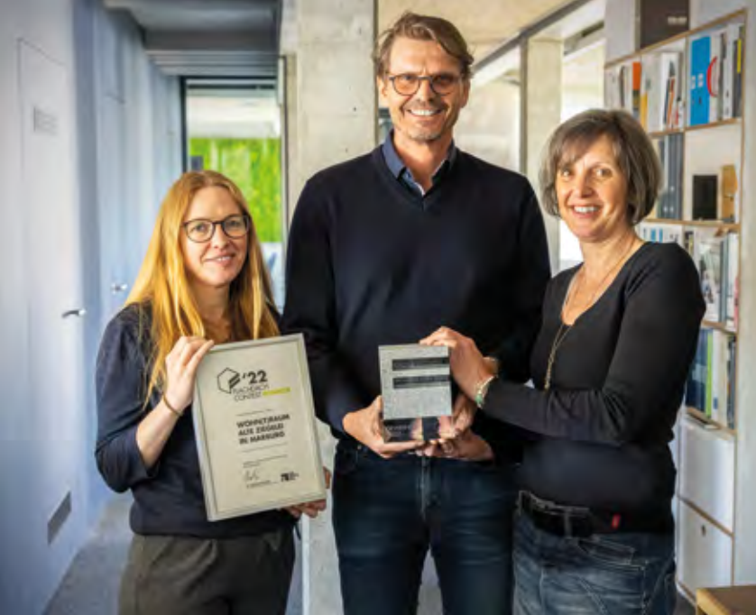
FDC-Gewinner 2022: Architekturbüro integrale planung aus Marburg.