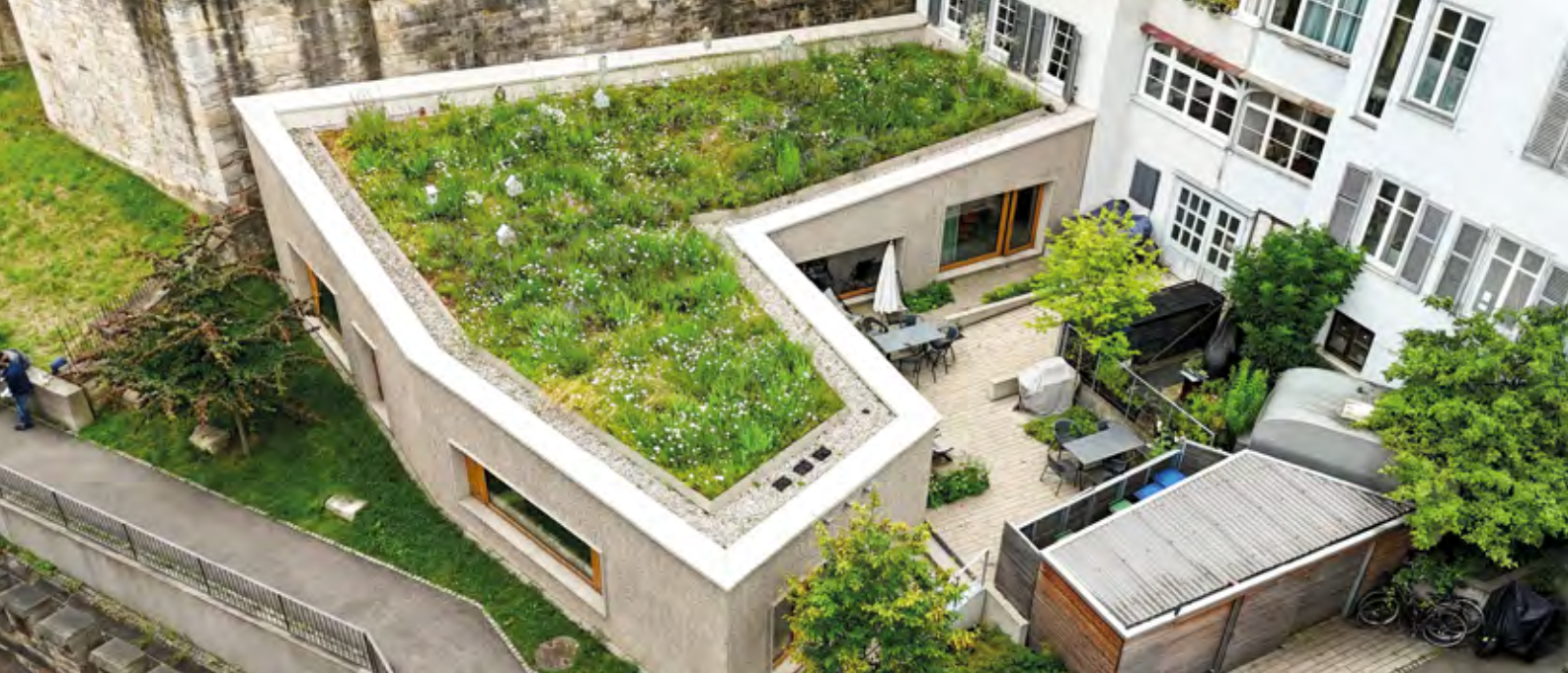
Das Gewinner-Objekt des Flachdach Contest 2023: Umbau und Erweiterung eines spätklassizistischen Wohn- und Geschäftshauses in der Tübinger Altstadt durch Dannien Roller Architekten + Partner.