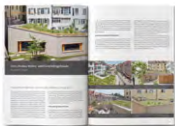
Ausführliche Berichterstattung über die Gewinner im Heinze Journal.