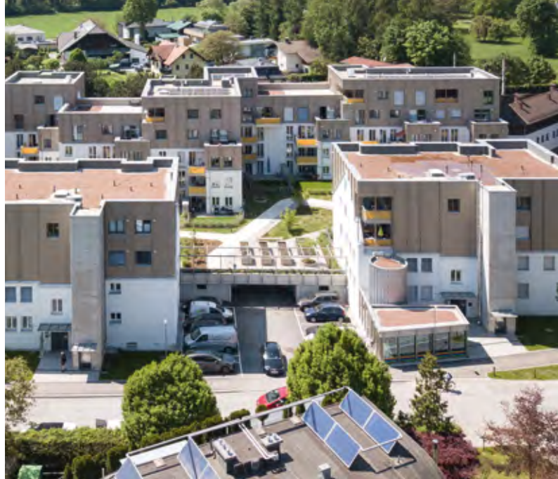
Aufstockung einer Bestandsiedlung in der Friedrich-Inhauser-Straße in Salzburg.