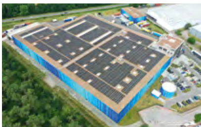
Die Logistikhalle Eco Hub verfügt über die größte PV-Gründach-Kombination Europas.

Energiedach: Photovoltaik und Solarthermie. Strom oder Warmwasser vor Ort zu erzeugen und zu verbrauchen, das macht das Energie-Flachdach zu einem wichtigen Baustein der Energiewende.