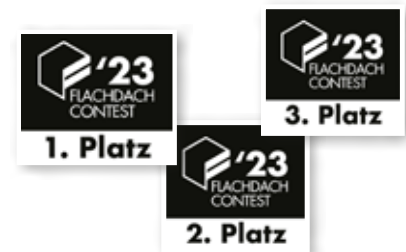
Nutzung der offiziellen Signets für die Plätze 1–12 in PR und Marketing.

Vorstellung in den sozialen Medien und im Jahreskalender. Möglichkeit der Nutzung der Kennzeichnung „Shortlist beim Flachdach Contest“.